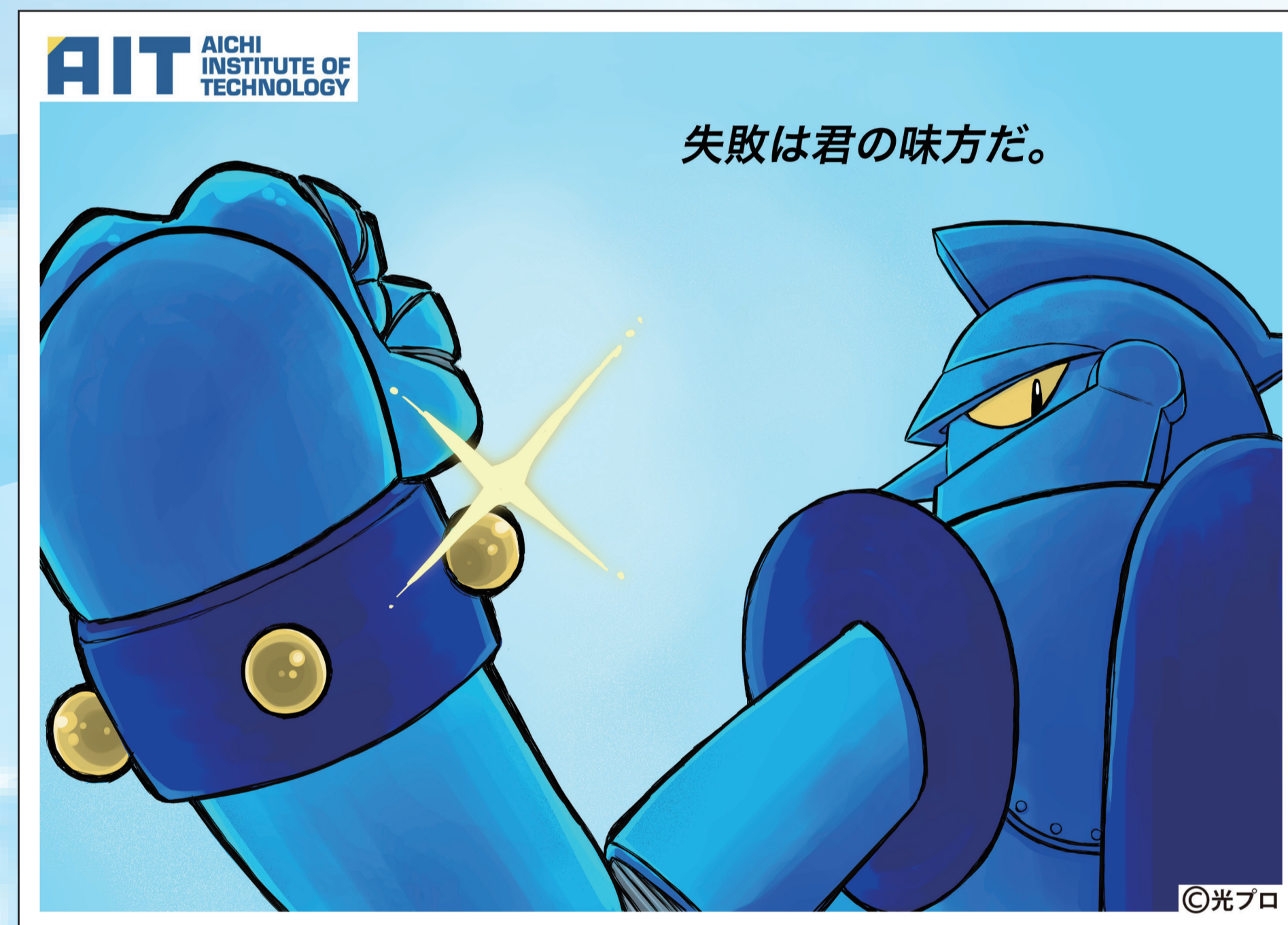
【作品に込めた思いやデザインの説明】

キャッチコピーやポージング、全体的なイメージは、鉄人28号というキャラクターを調べた時に、28号の28という数字は鉄人1号から、2号、3号…と失敗を積み重ねてきた証であるということから考えました。数々の失敗から生まれた鉄人28号が遅くガッツポーズをする事で、失敗する事は大切なこと、何事もチャレンジするのは大切なこと、というのを表現しました。看板的な視点では、腕をやや強調して描き、遅く頼れる感じをイメージし、前向きで明るいイメージにするために全体的に明るい青で表現し、差し色に黄色を用いて目を引くようにしました。