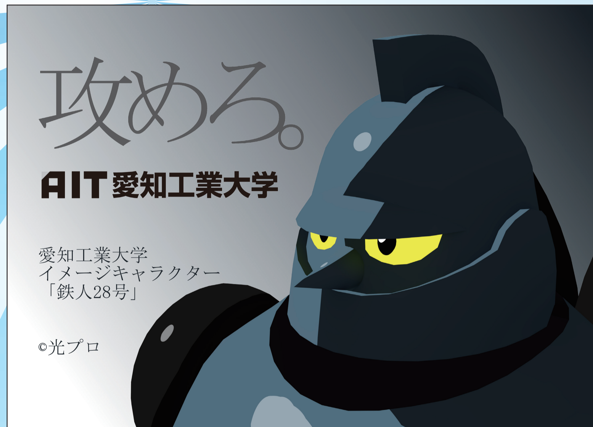
【作品に込めた思いやデザインの説明】

失敗を恐れずに挑戦しようというメッセージを表現するために、ただ事ではない表現の仕方をしようと思い、まず鉄人28号の3Dモデルを製作し、トゥーン調に整えたのちに、行く先を見るように左側を見つめる構図にしました。だから、一見べた塗りのように見えて、細部を見れば細かい陰影が見えるようになっています。そして背景を左側を明るくし、そこに文字等の情報を配置することで、未来が明るいことを示すと同時に、文字に視線を誘導できる配置になりました。